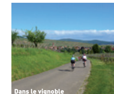
Dans le vignoble

Le retour se poursuit le long des prairies et de la rivière Fecht, puis emprunte les chemins ruraux de la Waldeslust, ramenant au centre d'Ingersheim, où il est possible d'admirer le pigeonnier du parc de Marchbach et la villa Fleck. Retour à Turckheim par le même chemin.