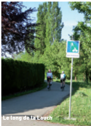
Le long de la Lauch

Quelques sections de l'itinéraire passent en ville (Colmar, Eguisheim, Wintzenheim) et utilisent des voies rurales sur des routes et des chemins moins fréquentés jusqu'à l'EuroVélo Route 5, via le quartier sud de Colmar jusqu'à la piste qui longe la rivière de la Thur.