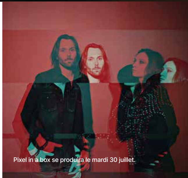
Pixel in a box se produira le mardi 30 juillet.

Romuald Wolf, co-gérant de l'Embuscade, faisait partie du jury. « C'est l'aspect live de la musique qui m'intéresse, car se produire en concert, ça ne trompe pas. » Et grâce à la scène off, les groupes peuvent jouer dans de bonnes conditions, accompagnés par des professionnels. Ils se confrontent au public de la FAV et bénéficient d'une visibilité accrue. Un atout non négligeable dans une carrière naissante.