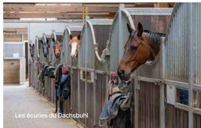
Les écuries du Dachsbuhl

l'équilibre du corps. L'équitation renforce aussi l'assurance grâce à la complicité avec le cheval. Pratiquée en simple loisir ou en véritable sport de compétition, elle regroupe un certain nombre de disciplines équestres : dressage qui consiste à faire évoluer les chevaux afin de montrer l'élégance de leurs mouvements et leur facilité d'emploi des mouvements imposés et d'extérieur dans la compétition, concours complet d'équitation, concours de saut d'obstacles, endurance avec des épreuves d'extérieur sur itinéraire balisé, attelage, monte western, randonnée... la liste est suffisamment fournie pour choisir votre activité favorite !