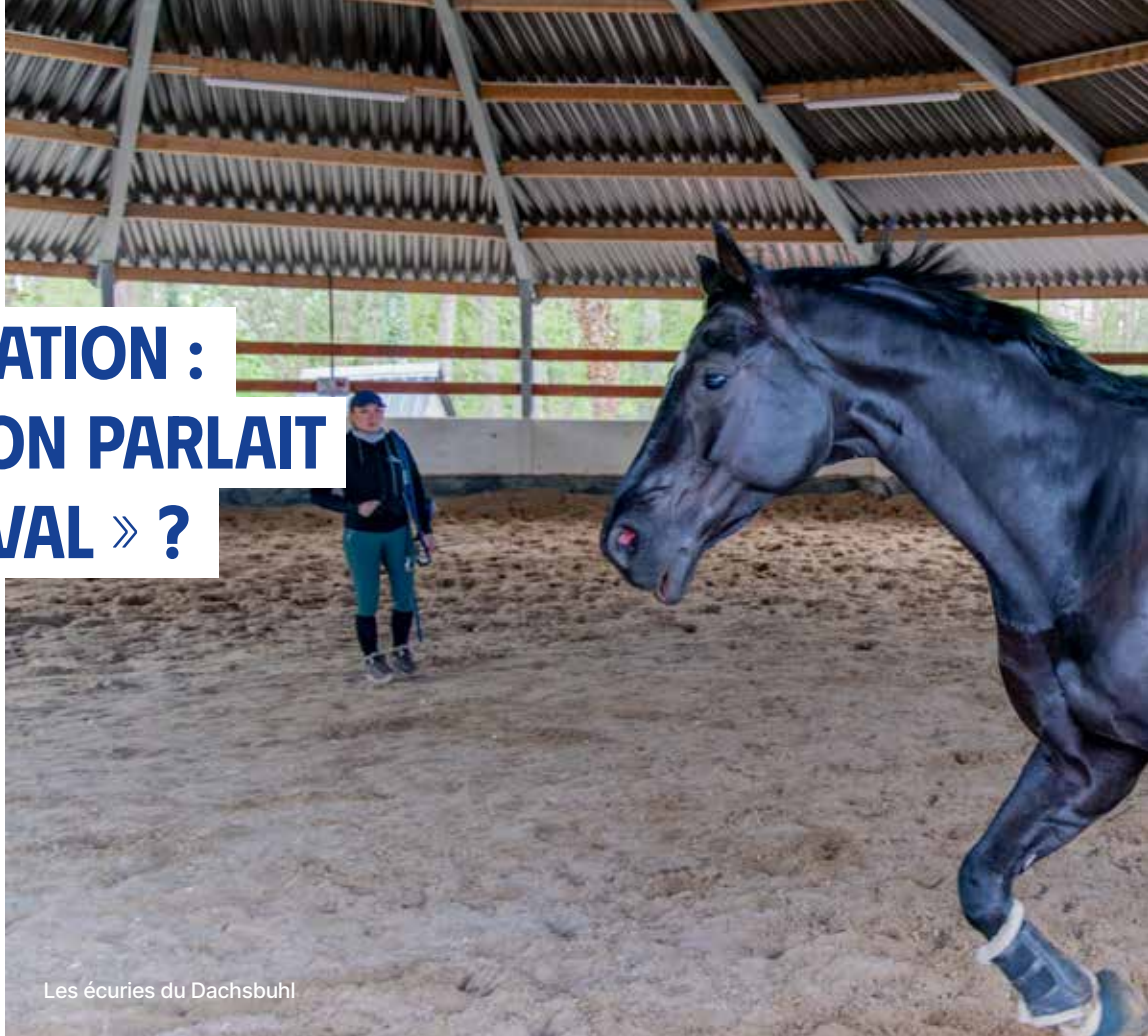
Les écuries du Dachsbuhl