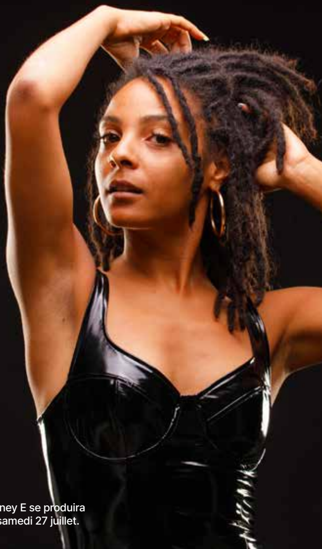
Honey E se produira le samedi 27 juillet.