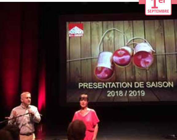
Présentation du nouveau programme de la nouvelle saison 2018/2019 Salle de spectacle Europe