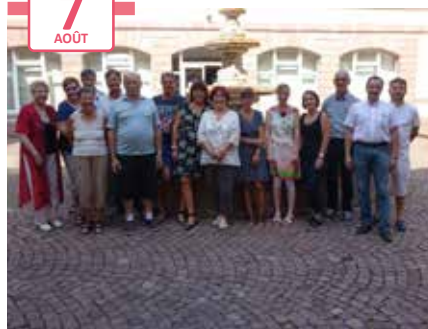
Colmar, ville fleurie : tournée du jury dans le cadre du concours annuel de décoration Mairie de Colmar