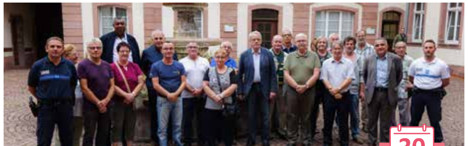
Rentrée des papys-mamys trafic Mairie de Colmar