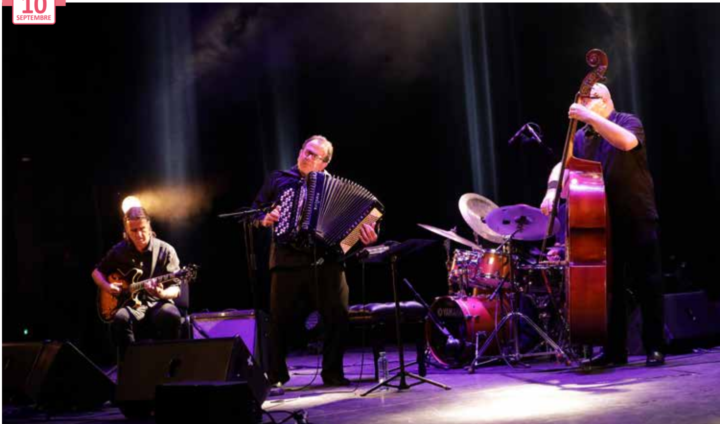
23 e édition du Festival de jazz de Colmar Salle de spectacle Europe