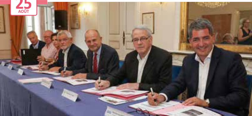
Signature de la convention-cadre "Action cœur de ville", en présence de M. le Préfet du Haut-Rhin, de M. Jean Rottner, Président de la Région Grand Est, et des autres partenaires institutionnels : Caisse des dépôts, Action logement, Chambre de commerce et d'industrie Alsace Eurométropole, Chambre de métiers d'Alsace, Pôle habitat Colmar Centre Alsace et Colmar habitat Mairie de Colmar