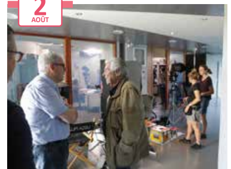
Visite sur les lieux du tournage du film "Meurtre à Colmar", avec Pierre Arditi et l'équipe de production