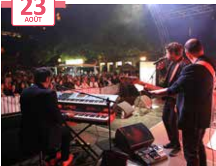
5 e édition de la Summer night Place du marché aux fruits