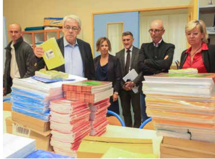
Tournée des écoles avant la rentrée scolaire