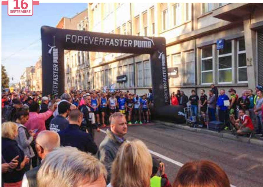
4 e Marathon solidaire de Colmar Centre-ville