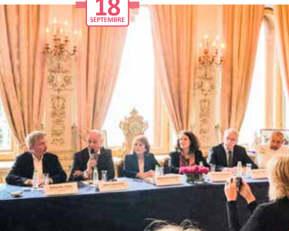
Rencontre de presse à la résidence de l'Ambassadeur de France à Moscou, avec les différents partenaires associés à l'opération de l'Agence d'attractivité d'Alsace Résidence de l'Ambassadeur de France à Moscou