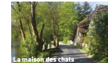
La maison des chats

La visite du Centre Historique d'Eguisheim , le parcours dans le vignoble au pied des Vosges, la grotte de la réplique de Mas-sabielle en se dirigeant vers la Mairie de Wettolsheim (détour par le centre-ville).