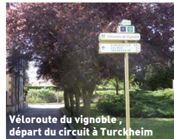
Véloroute du vignoble, départ du circuit à Turckheim

Distance : 20km Difficulté : moyenne Temps de parcours : env. 2h