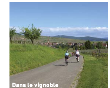
Dans le vignoble

Le retour se poursuit le long des prairies et de la rivière Fecht, puis emprunte les chemins ruraux de la Waldeslust, ramenant au centre d'Ingersheim, où il est possible d'admirer le pigeonier du parc de Marchbach et la villa Fleck. Retour à Turckheim par le même chemin.