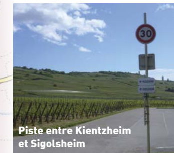
Piste entre Kientzheim et Sigolsheim

La variante 4 consiste à traverser le village et emprunter la route du vin pour rejoindre directement le centre-ville de Kaysersberg.