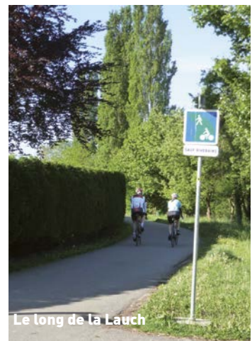
Le long de la Lauch

Quelques sections de l'itinéraire passent en ville (Colmar, Eguisheim, Wintzenheim) et utilisent des voies rurales sur des routes et des chemins moins fréquentés jusqu'à l'EuroVélo Route 5, via le quartier sud de Colmar jusqu'à la piste qui longe la rivière de la Thur.