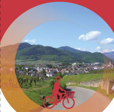
Boucle d'Alsace à vélo

Enfin, Kaysersberg (son centre historique et son château) mérite le détour.