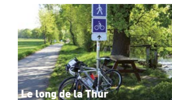
Le long de la Thur