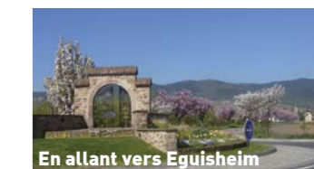
En allant vers Eguisheim