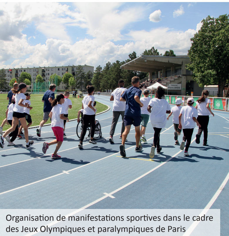
Organisation de manifestations sportives dans le cadre des Jeux Olympiques et paralympiques de Paris