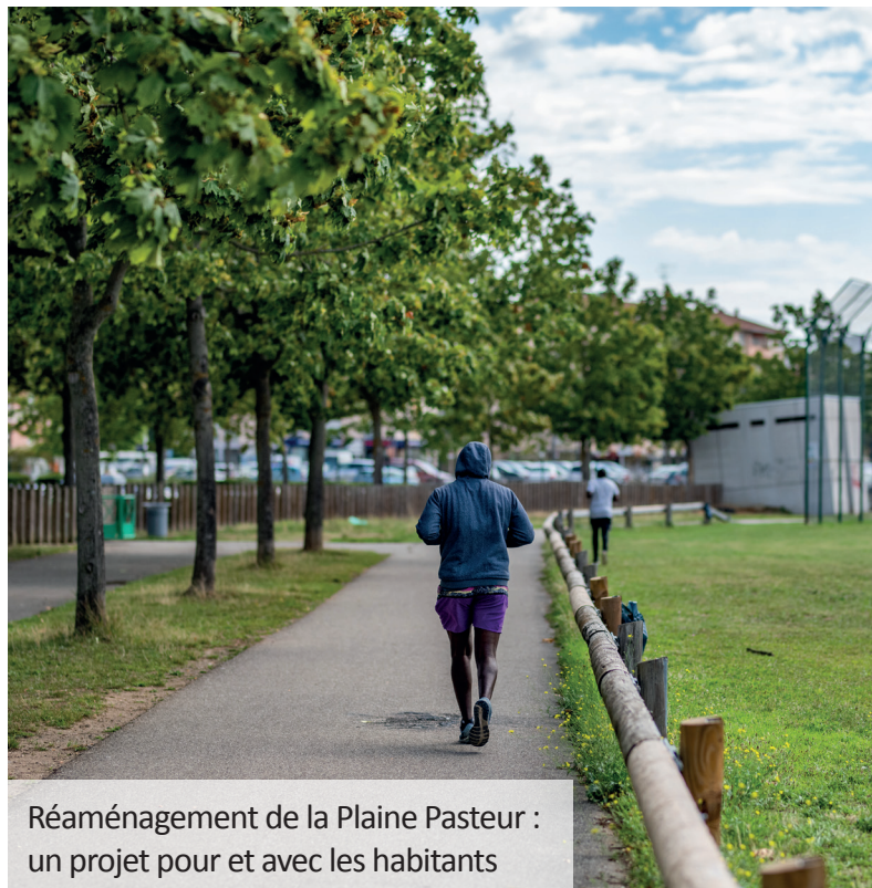
Réaménagement de la Plaine Pasteur : un projet pour et avec les habitants