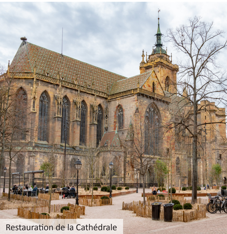
Restauration de la Cathédrale