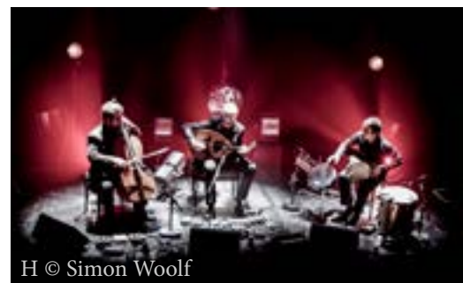
H © Simon Woolf