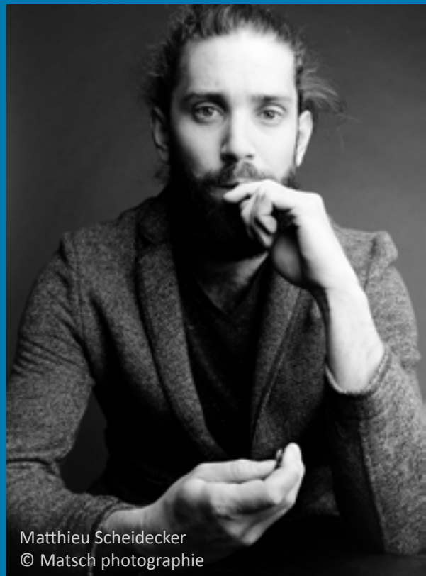
Matthieu Scheidecker