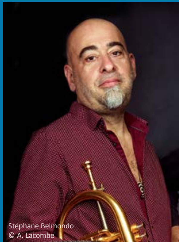
Stéphane Belmondo