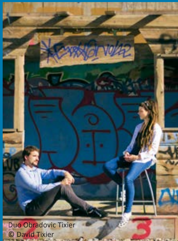
Duo Obradovic Tixier