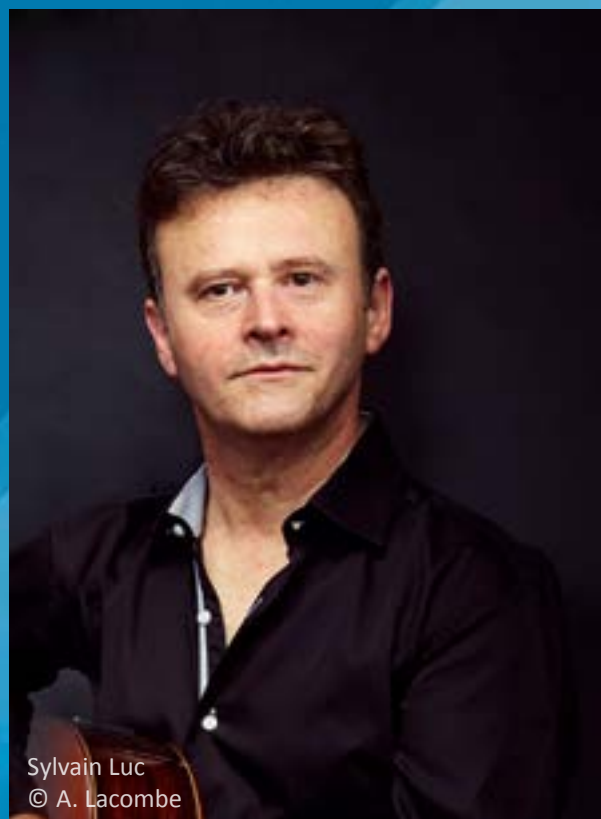
Sylvain Luc