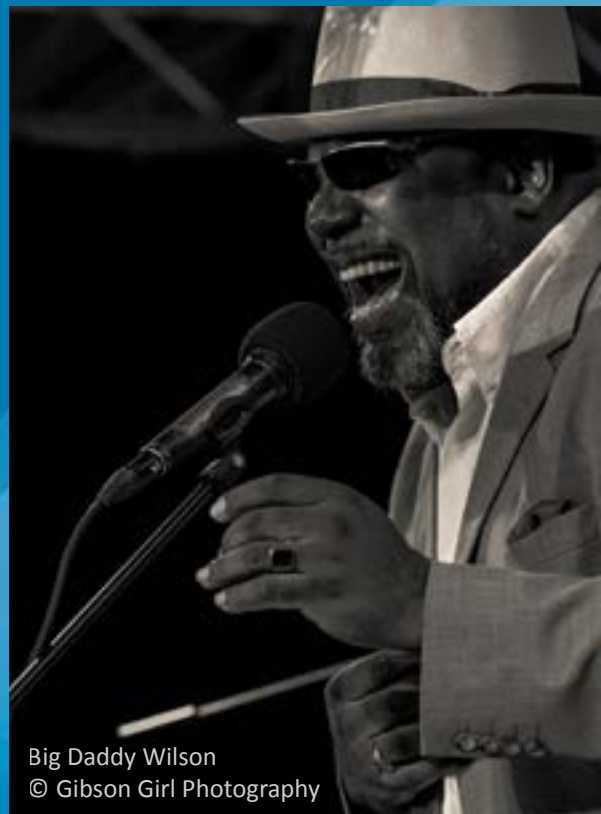
Big Daddy Wilson