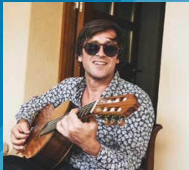
Thomas Dutronc