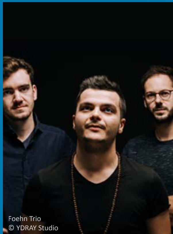
Foehn Trio