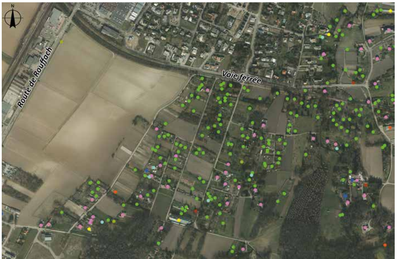
↑ Extrait du recensement des constructions en zone agricole et naturelle