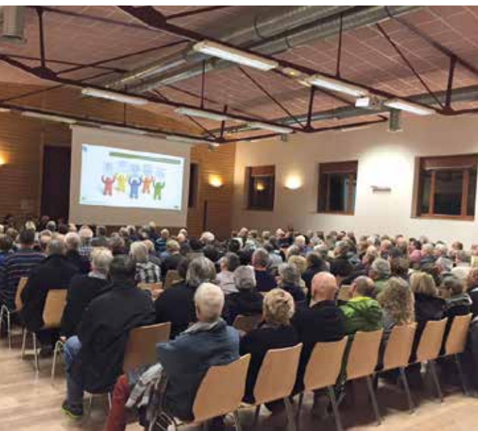
↑ Première réunion publique