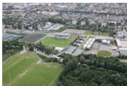
↑ Colmar Stadium