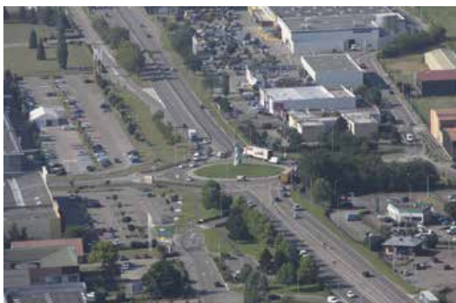
↑ Stationnement en zones d'activités