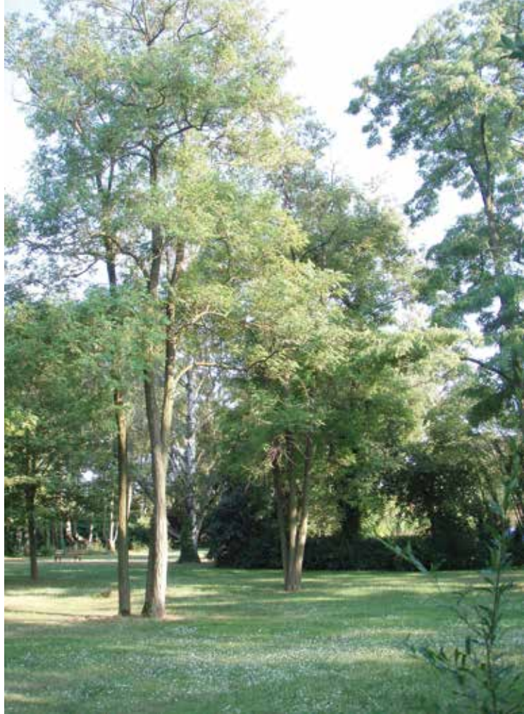
↑ Parc du Château Kiener