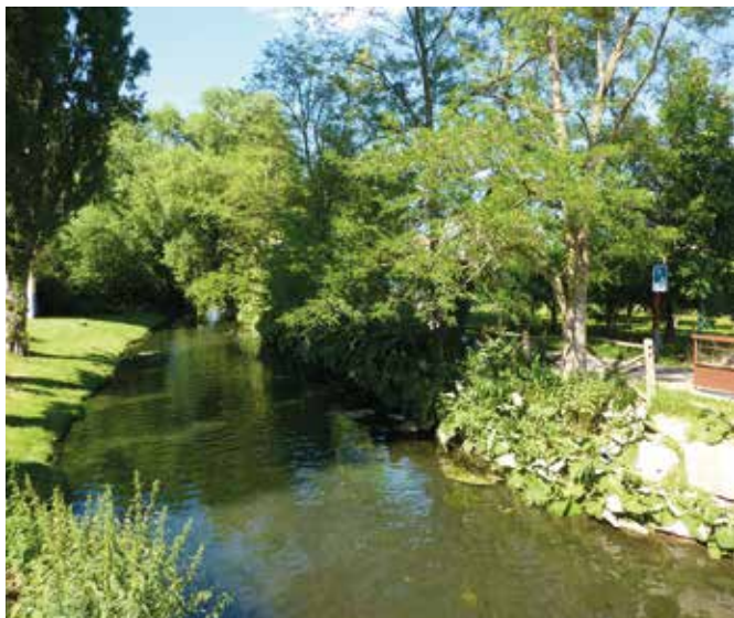
↑ La Lauch