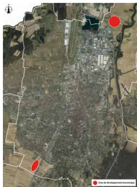
↑ Zones d'extension économique