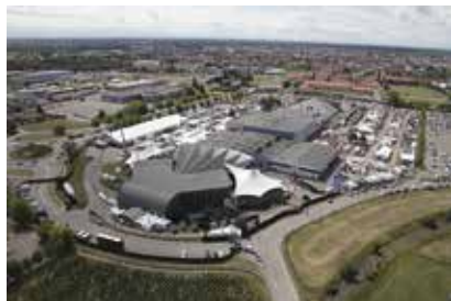
↑ Parc des expositions