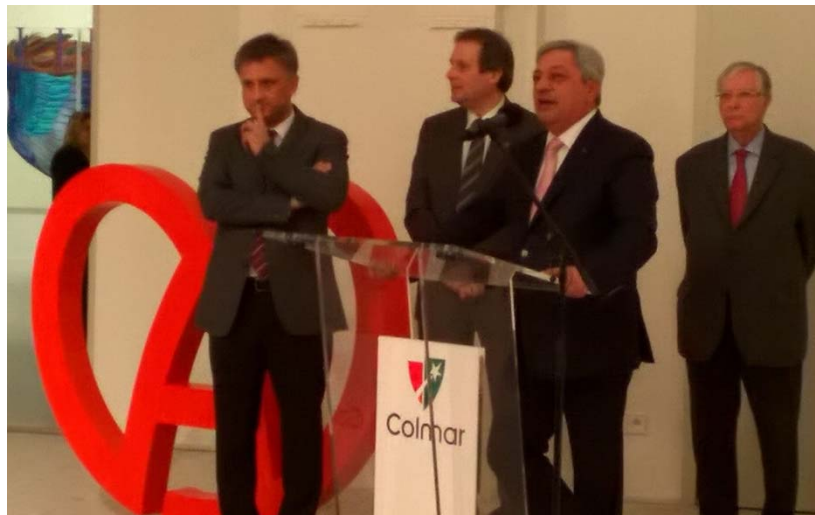
Intervention de Javanshir FEYZIYEV, Député de Shéki et ambassadeur de Colmar

15 décembre : L'agence d'Attractivité de l'Alsace, avec le soutien de la Ville de Colmar, invite les ambassadeurs d'Alsace, de la marque Alsace ainsi que les ambassadeurs de Colmar à une soirée prestige de découverte du nouveau Musée Unterlinden.