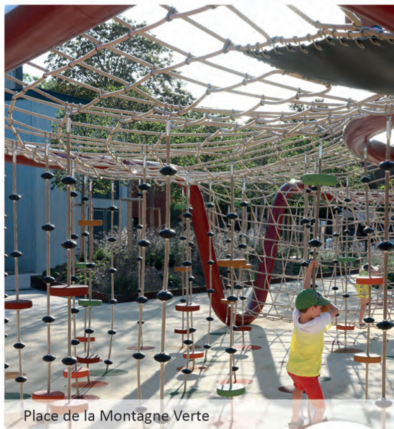
Place de la Montagne Verte