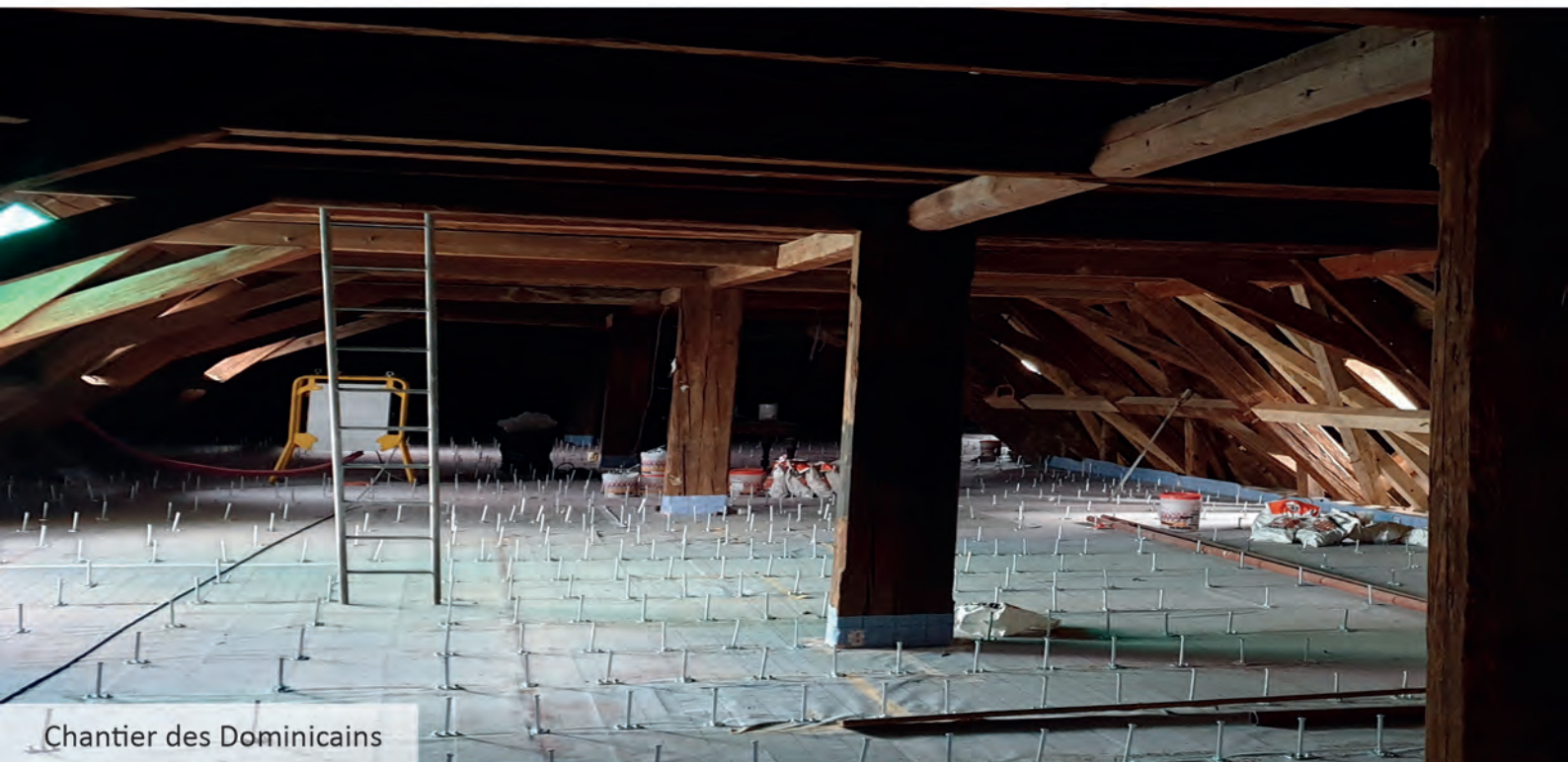
Chantier des Dominicains