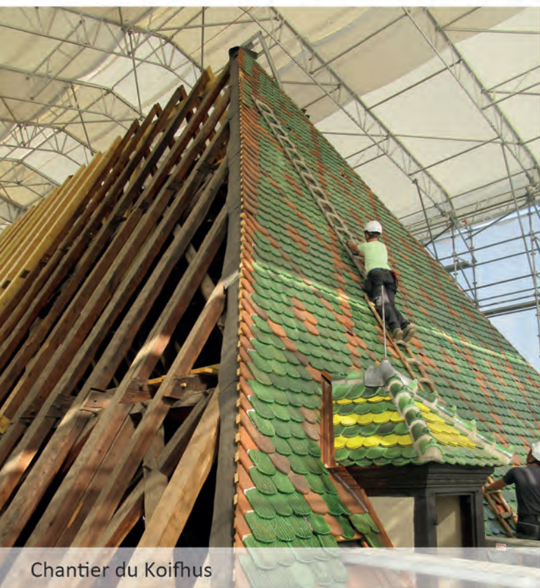
Chantier du Koifhus