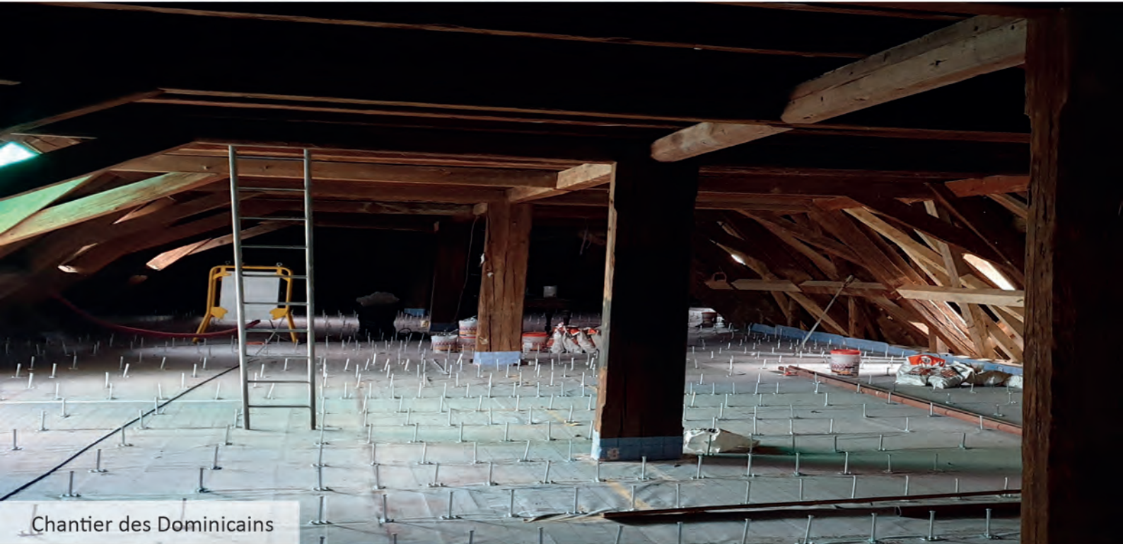
Chantier des Dominicains