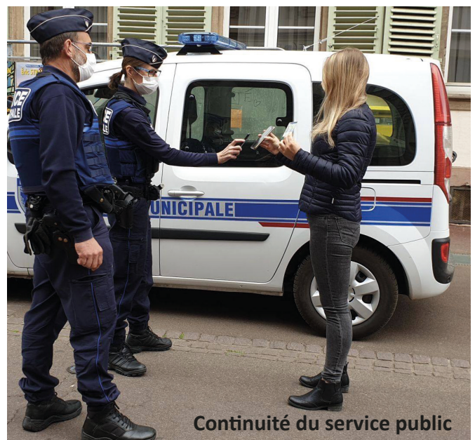
Continuité du service public