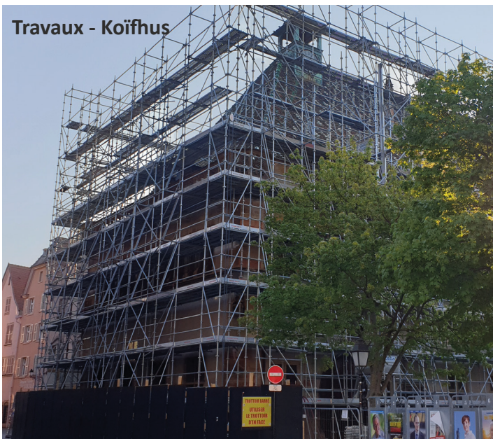
Travaux - Koïfhus