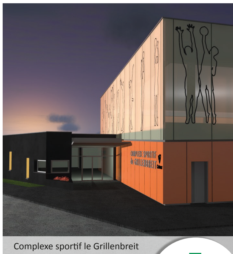
Complexe sportif le Grillenbreit