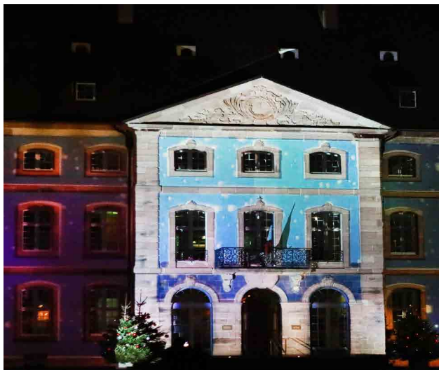
Plan animation lumière - Pôle média - culture Edmond Gerrer