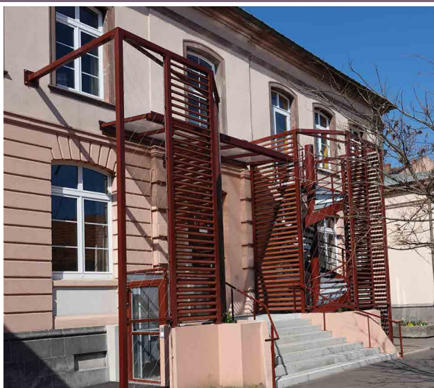
Travaux d'accessibilité à l'école Hirn