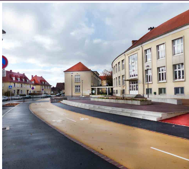
Aménagement global de la rue Geiler