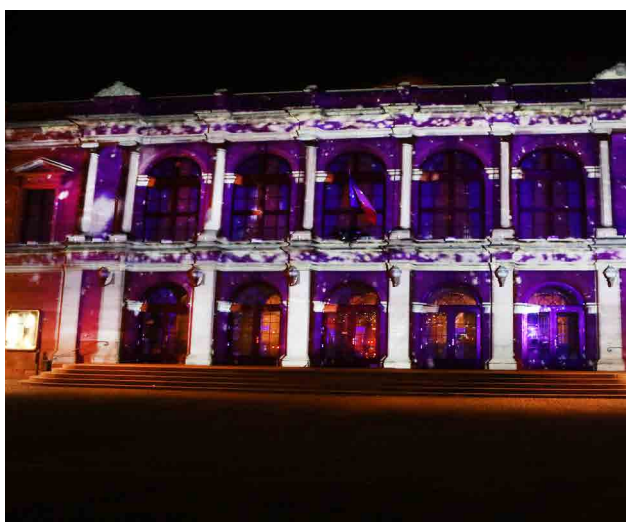
Plan animation lumière - Théâtre municipal