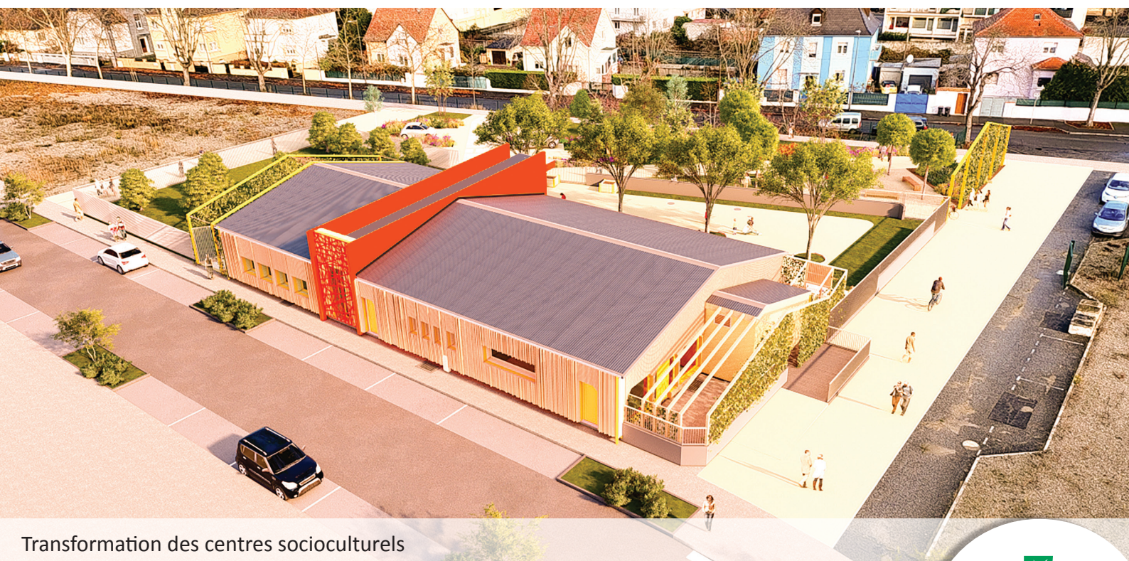
Transformation des centres socioculturels