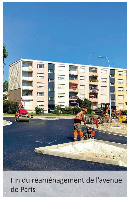
Fin du réaménagement de l'avenue de Paris