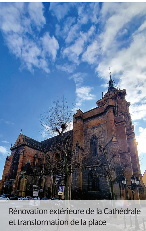
Rénovation extérieure de la Cathédrale et transformation de la place